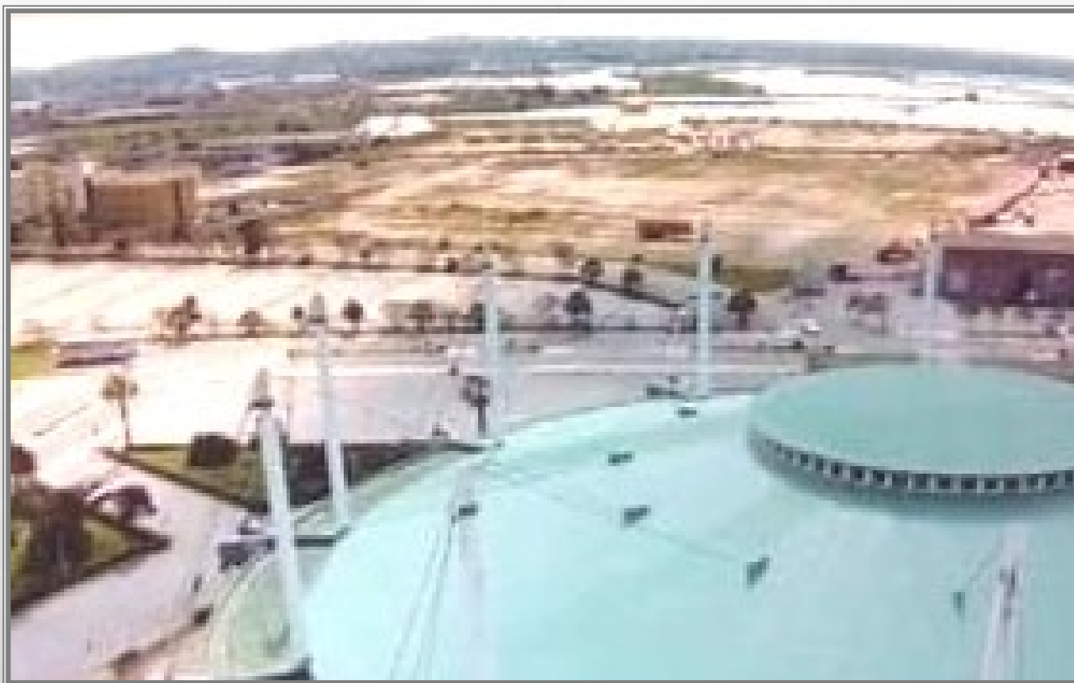
PALAZZETTO DELLO SPORT DI TRAPANI