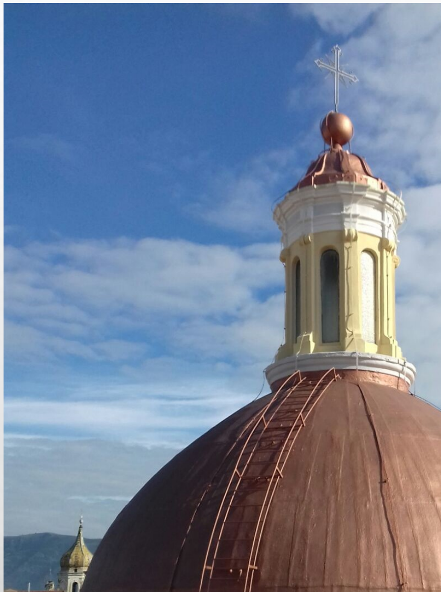
CUPOLA CATTEDRALE NOLA (NA)