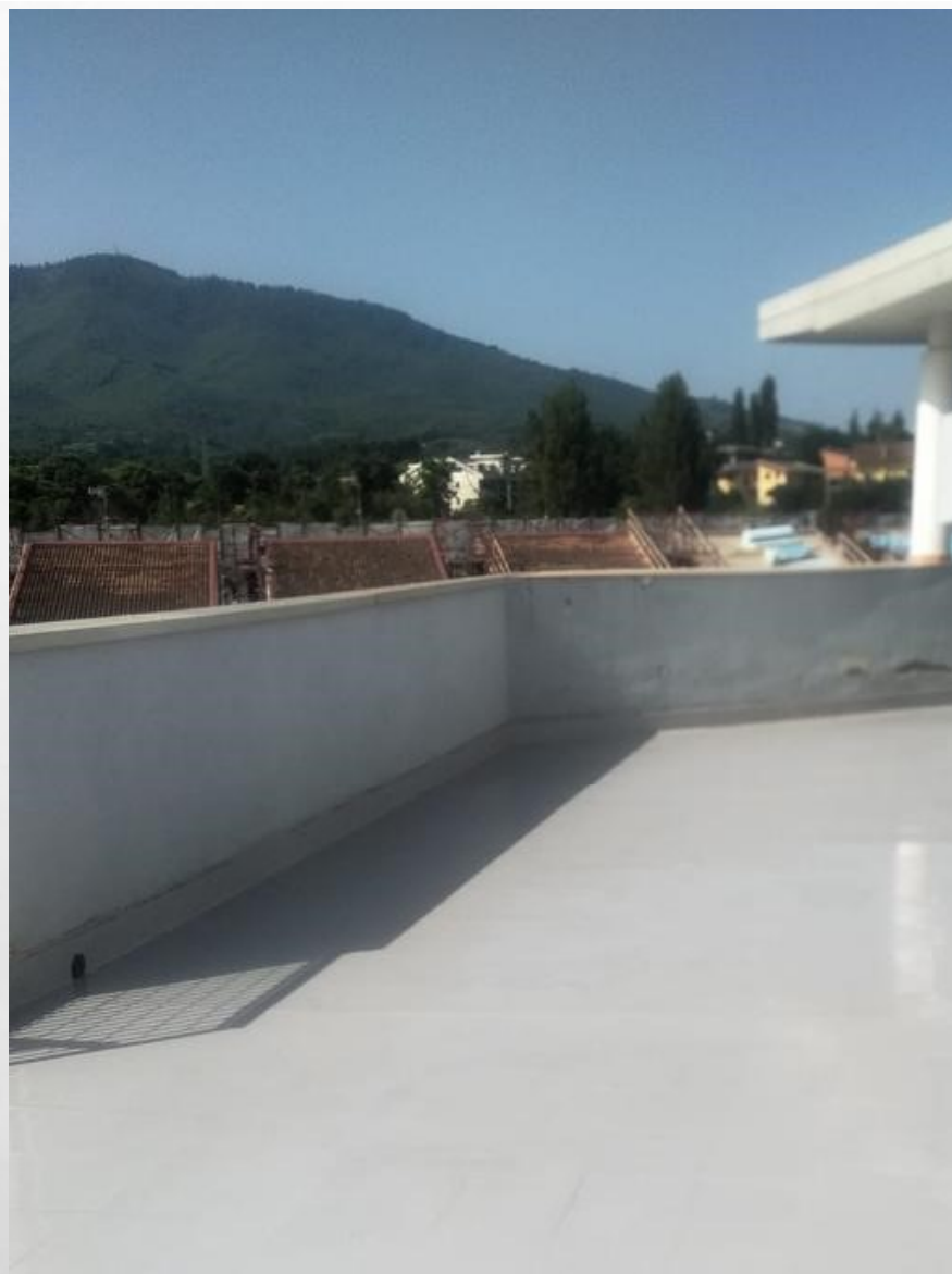
OSPEDALE DI MELFI (PZ)