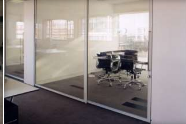
Pareti manovrabili In vetro