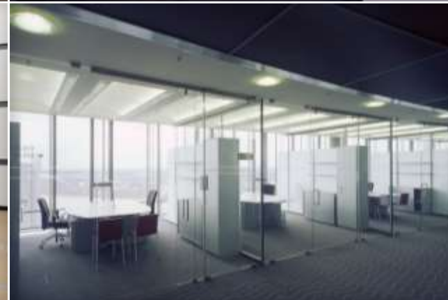
Sistemi tuttovetro manuali