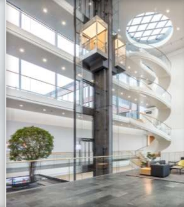
IO 420 modulo di interfaccia