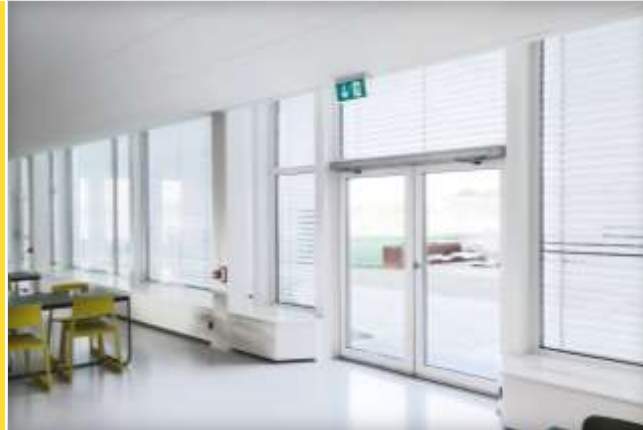
Porte a battente

Porte a battente, porte scorrevoli lineari, porte scorrevoli circolari e semicircolari e porte girevoli