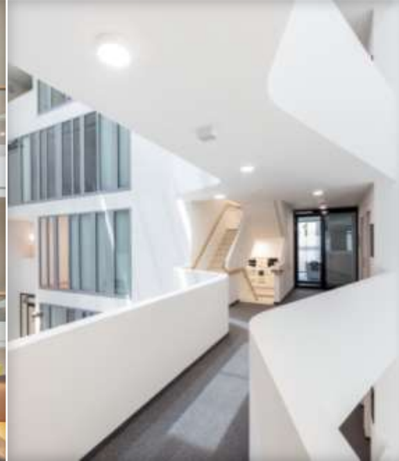
IQ box KNX modulo di interfaccia