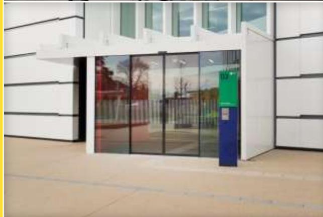
Sistemi integrati tuttovetro