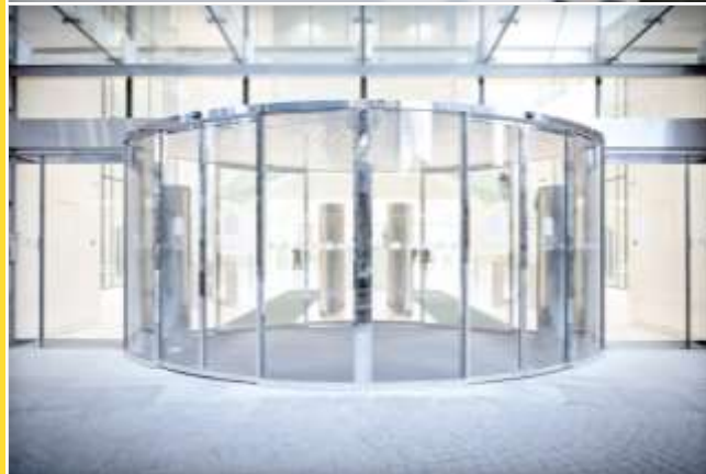
Porte circolari e semicircolari