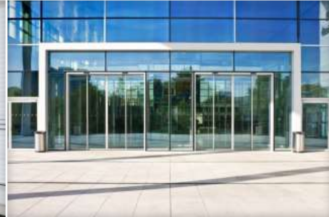
Porte scorrevoli lineari