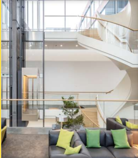
GEZE Cockpit Sistema di integrazione automatica dell'edificio