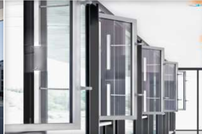
Attuatori A catena